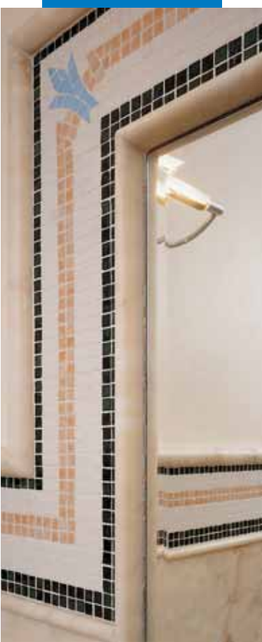
Пример художественного оформления мозаикой, сделанной из разных материалов

ООО "ЕВРОПЕЙСКИЕ СТРОИТЕЛЬНЫЕ РЕШЕНИЯ" +7 (343) 382-40-08 ZAKAZ@MAPEIURAL.RU ПРОДУКЦИЯ MAPEI БЕЗ ПОСРЕДНИКОВ