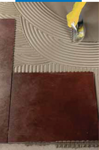
Укладка керамической плитки на стену