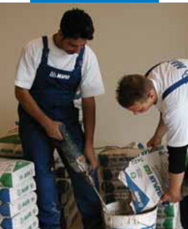
Смешивание Ultraplan Eco, детский сад "Мирабэлло", Канту, Италия