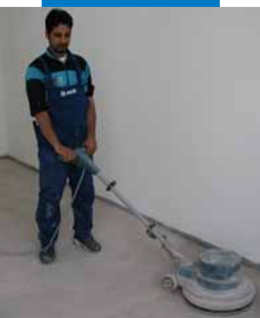
Подготовка основания шлифовальной машиной перед нанесением Ultraplan Eco, детский сад "Мирабэлло", Канту, Италия