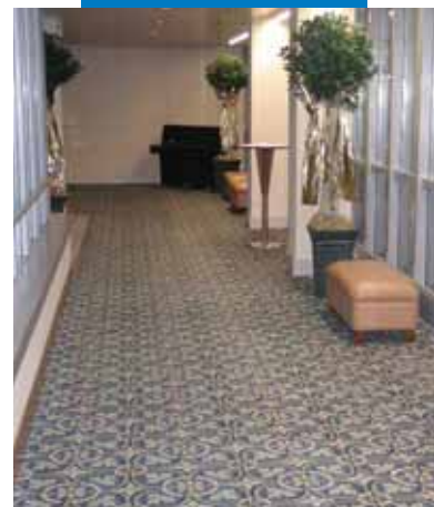
Ковровое покрытие, уложенное в коридоре отеля Ренессанс в Австрии после выравнивания составом Ultraplan Eco .

Данный символ используется для идентификации продуктов MAPEI с низкой эмиссией летучих органических соединений (VOC) в соответствии с сертификацией GEV, международной организации, контролирующей уровень эмиссий материалов, применяемых для создания полов.