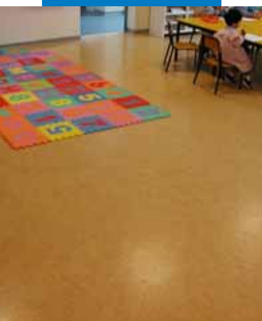
Линолеум, уложенный на стяжку, предварительно выровненную Ultraplan Eco, детский сад "Мирабэлло", Канту, Италия