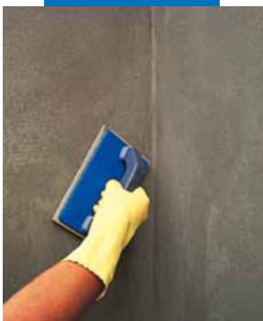
Финишная обработка губчатой теркой